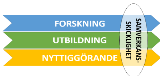
Figur 3: Samverkansskicklighet i relation samband med Chalmers huvudprocesser.

Genom universitetens och högskolornas samverkan med det omgivande samhället ökar kvalitet i utbildning och forskning samt säkerställer vetenskapligt djup och relevans. Samverkan är grunden för att dels nyttiggöra vår kunskap och våra resultat, men också för att höja kvaliteten på vår forskning och utbildning. Samverkansskicklighet, som visar individens förmåga att samverka, skär genom Chalmers tre huvudprocesser, forskning, utbildning och nyttiggörande, se figur 3 nedan.