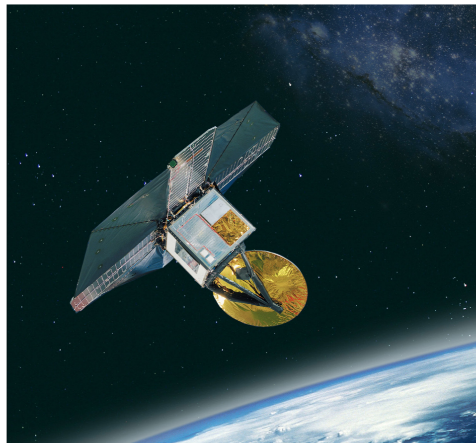
Odinsatelliten sköts upp 2001 och är ett samarbete mellan Sverige, Frankrike, Kanada och Finland.

I ett sådant arbete observeras ett mycket brett våglängdsband för att undersöka vilka molekyler som finns i detta