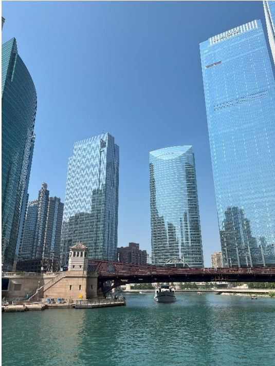
Figur 3. Bild från arkitekturbåtturen i Chicago. Solen sken till skillnad ifrån dagen innan då det var blåsigt och dimmigt.

åldrar. Alla som jobbar för CAC är volontärer och gör det därmed enbart i syfte att sprida kunskap. Jag valde att gå på en båttur samt en walking tour. Båtturen bestod av en 1.5h färd längs floden där en guide pratade om alla byggnader vi passerade samt hur dessa har bidragit till att utveckla stadskärnan i Chicago. Det var otroligt mycket information vi fick, allt från detaljer om materialval till intressant fakta om respektive byggnad. Båtturen var en fantastisk introduktion till Chicagos rika arkitektur och det var underbart att åka längs floden och vara omringad av skyskrapor.