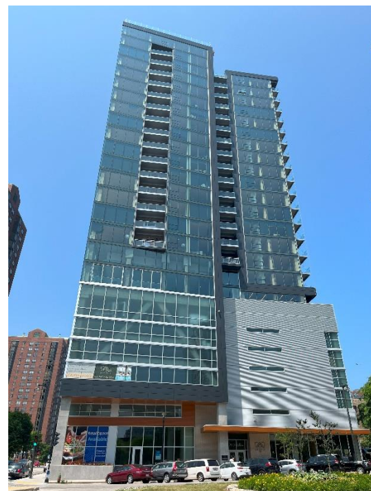
Figur 8. Ascent, Milwaukee. Världens högsta trähybridskyskrapa på 86.6 meter. Träpelarna kan skymtas vid kanten av fasaden.

Sammanfattningsvis har jag haft en otroligt underbar, lärorik och inspirerande resa till Chicago och Milwaukee. Jag känner mig väldigt inspirerad att fortsätta lära mig mer om höga byggnader och kommer definitivt att åka tillbaka till Chicago igen för att utforska staden än mer. Jag vill rikta ett oerhört stort tack för äran att få detta stipendium och den möjlighet att genomföra denna resa som det har inneburit. Jag kommer bära med mig alla minnen, erfarenheter och lärdomar för resten av livet och det är jag otroligt tacksam för!