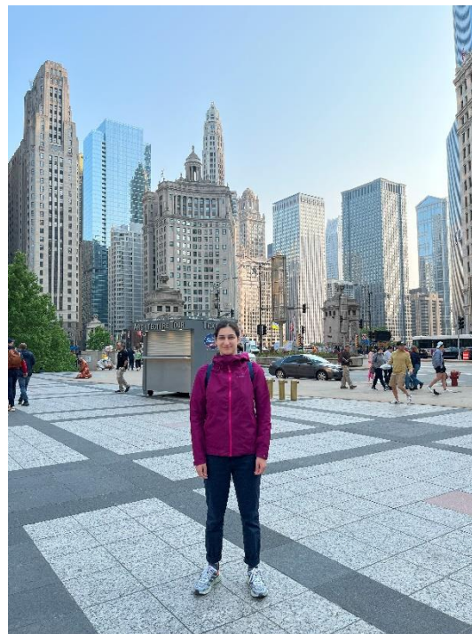
Figur 2. Bild på mig i downtown Chicago, även kallat för The Loop.

Första heldagen i Chicago spenderades genom att utforska staden på fots – ett av de bästa sätten att utforska en ny stad på enligt mig. Jag besökte de typiska turistmålen så som John Hancock Center, Cloud Gate, Tribune Tower, Wrigley Building och Willis Tower. Detta gav mig en bra överblick över staden inför den stundande arkitekturbåtturen jag skulle gå på dagen efter. Chicago har ett arkitekturcenter (Chicago Architecture Center, CAC) som ämnar åt att sprida kunskap om både Chicagos arkitekturhistoria samt arkitektur i helhet. De gör detta genom guidade turer på fots och via båt, utställningar samt program anpassade för olika