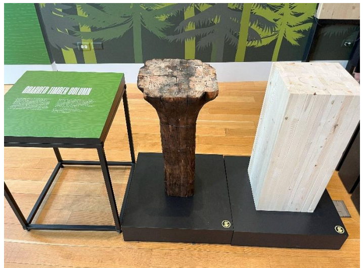
Figur 6. Brandtest på en träpelare från Ascent i Milwaukee, utställd vid Chicago Architecture Center. Pelaren fick brinna i 3 timmar för att se hur branden skulle förstöra pelaren.

Det som imponerade mig mest med Chicago var hur genomtänkt staden är och den enorma kunskap om arkitektur som frodas i staden. Det märks väldigt tydligt att staden är stolt över sin arkitektur och att de gärna sprider kunskap om den utan att för den delen skryta om sina byggnader. Det är något jag uppskattar enormt mycket och upplever att det är ganska sällsynt att en stad belyser sin arkitektur i den mån att de har ett eget arkitekturcenter med olika typer av turer, evenemang och utställningar ägnat åt arkitektur. Vidare tyckte jag även att stadsplaneringen i Chicago var väldigt intressant, där de fokuserat på att ha en varierad arkitektur samt nära tillgång till olika funktioner i centrum. De har till exempel en sandstrand (North Michigan Beach) några få kilometer från centrum där man kan sola och bada med en otrolig utsikt över staden. Det var riktigt häftigt att se och uppleva den kontrasten! I övrigt hade de parker, motorväg, rejäla cykel- och gångbanor, riverwalk, höga och låga byggnader