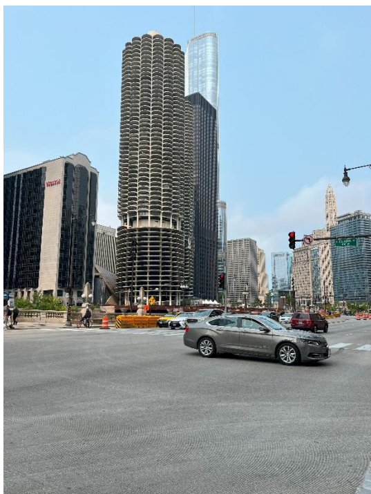
Figur 1. Marina City. Första vyn jag möttes av när jag gick upp för tunnelbanestationen.

Det har gått en dryg månad sedan jag kom hem från USA och jag drömmer fortfarande tillbaka till alla fantastiska minnen jag fått uppleva under resan. I mitten av Juni flög jag till Chicago och stannade där i 6 nätter. Efter en lång flygresa var det äntligen dags att ta tunnelbanan från flygplatsen till centrala Chicago. Det första jag såg när jag gick upp från tunnelbanestationen var Marina City (Figur 1) följt av en omgivning full av höga byggnader. Det kändes otroligt häftigt att mötas av den vyn och äntligen få uppleva staden som jag läst så mycket om. Marina City är två byggnader som ligger vid floden i centrala Chicago som i geometrin liknar majskolvar. Byggnaderna är tänkta att fungera som en vertikal stad inom en och samma byggnad och består därmed av bostäder, parkering, restauranger, affärer samt en privat båthamn. Detta är något som jag utforskade i mitt examensarbete inom arkitektur under våren, det vill säga hur höga byggnader kan fungera som vertikala städer och vilka fördelar detta har, så det var extra kul och spännande att få se en sådan typ av byggnad i verkligheten.