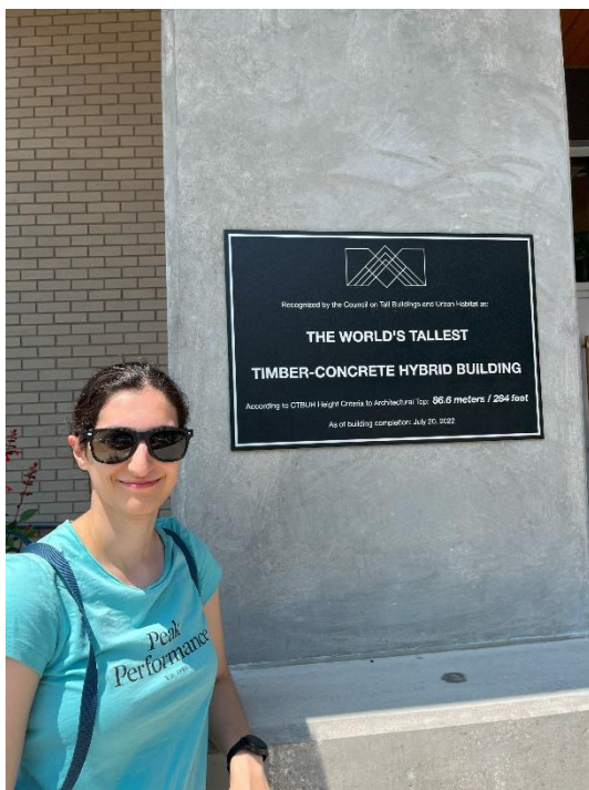
Figur 7. Jag bredvid utmärkelsen som Ascent fått av CTBUH (Council of Tall Buildings and Urban Habitat).

Efter 6 underbara dagar i Chicago var det dags att ta tåget till Milwaukee, Wisconsin. Det var väldigt smidigt att åka mellan städerna och Milwaukee låg bara 1.5h ifrån Chicago med tåg. Likt Chicago ligger även Milwaukee vid Lake Michigan och även de hade några mindre floder i centrum. Det märktes väldigt tydligt att Milwaukee är en betydligt mindre stad än Chicago och det fanns inte lika mycket att se eller uppleva där. Däremot var staden väldigt lugn och det var skönt att få en liten paus från en storstad. Den primära anledningen till besöket i Milwaukee var Ascent; en 86.6 meter träskyskrapa som till dagens datum är världens högsta. Byggnaden låg en kort bit ifrån centrum och stack inte ut särskilt mycket i området som den befann sig i. Byggnaden består av lägenheter och de hade en entré med reception vilket antydde på en privat byggnad med lyxiga lägenheter.