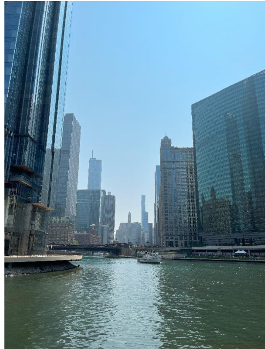
Figur 4. Bild från arkitekturbåtturen i Chicago.

Den andra guidade turen jag gick på bestod av en walking tour med temat Chicago Icons: Connecting Past and Present . Det var väldigt svårt att bestämma sig för vilken typ av tur jag ville gå på då de erbjöd flera med olika inriktningar och jag ville helt enkelt gå på alla. Chicago Icons gav mig dock en bra blandning av olika arkitekturstilar då vi stannade vid olika byggnader från 1900-talet ända fram till idag. Vid varje stopp gav guiden oss mer information om byggnaden, arkitekten bakom byggnaden samt vilken inverkan den haft på Chicago som stad. Vi fick även gå in i vissa byggnader och se delar av interiörerna. Jag uppskattade verkligen att gå på en walking tour då jag fick möjlighet att ställa frågor till guiden och även lära känna de andra personerna som gick på turen. Jag var den enda från Europa i gruppen vilket fascinerade några då alla förutom en kvinna från Indien var från andra delar av USA.