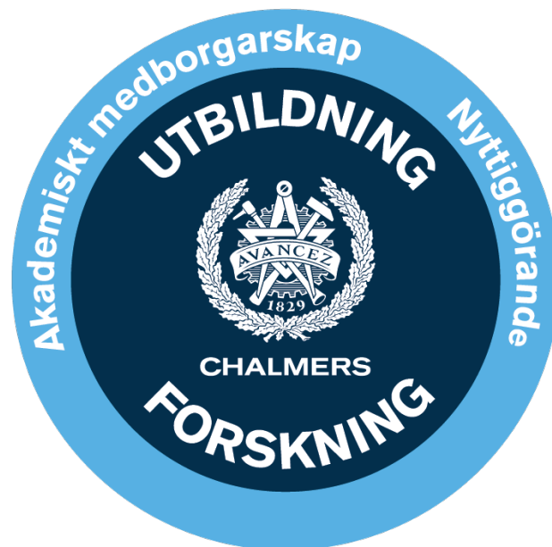
Figur 1: Chalmers kompetensområden och hur de relaterar till varandra.

Chalmers akademiska tjänster har normalt fokus på både forskning och utbildning, men det är viktigt att lärare och forskare får möjlighet att verka och bidra inom alla kompetensområden, det vill säga även inom nyttiggörande och akademiskt medborgarskap. Fokus och proportioner mellan kompetensområdena kan skifta beroende på tjänstekategori och var medarbetaren befinner sig i sin karriär.