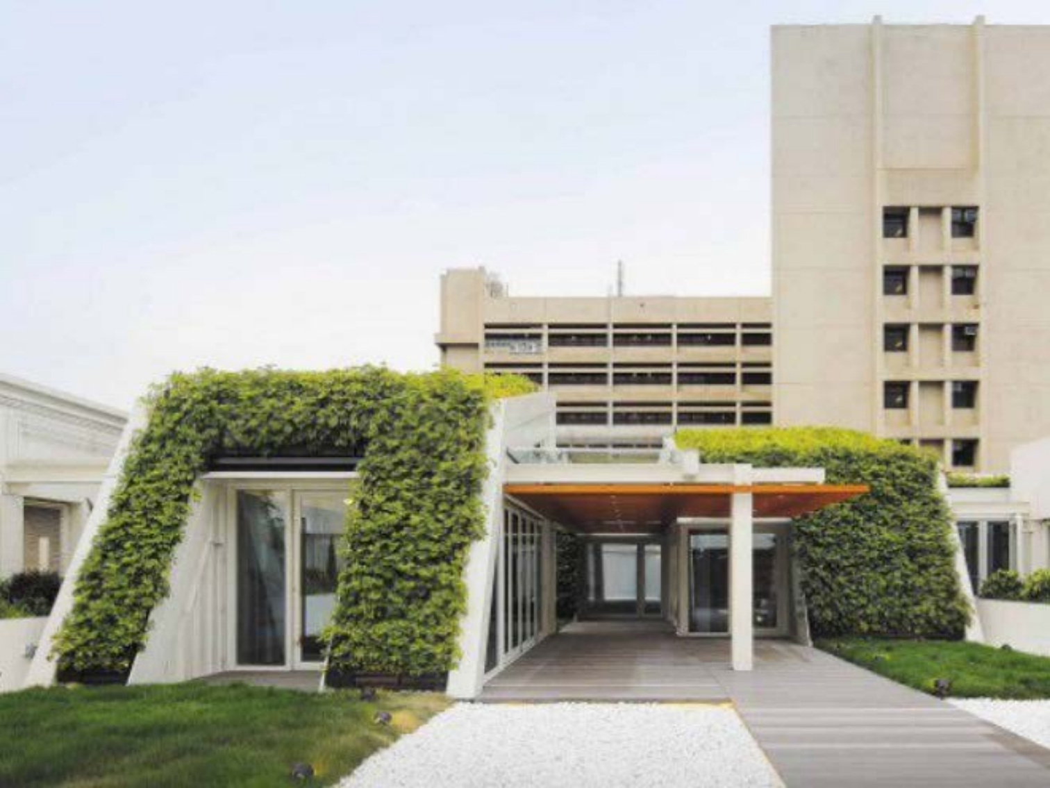
SK Yee Healthy life centre. Ronald Lu & Partners